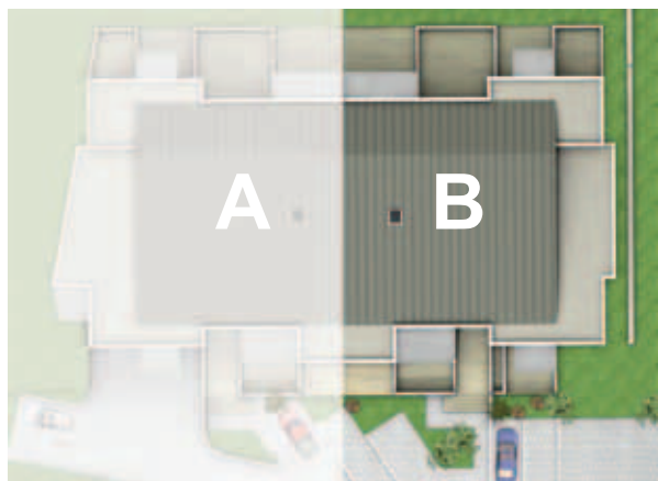
Bâtiment B - Appartement 15 - T3 - Etage n°2

Architecte : Jean Georges CAMPRUBI Tél : +33 3 29 87 33 43